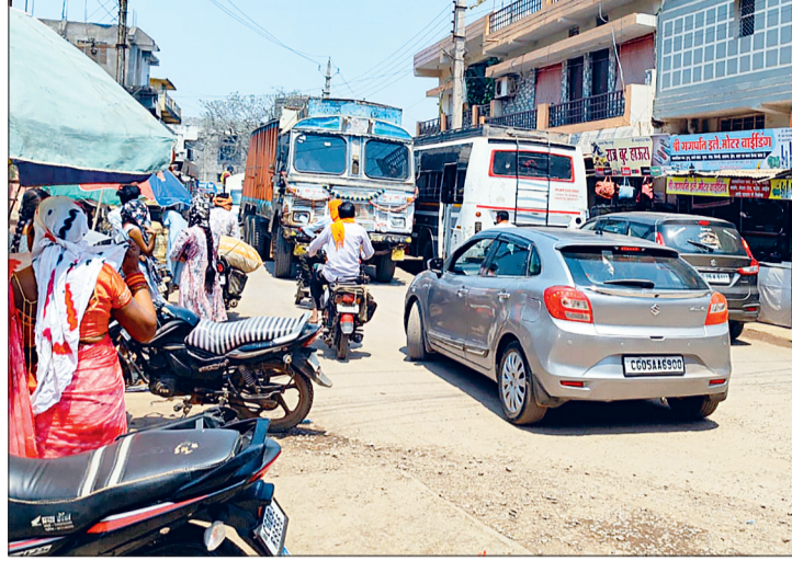
कारण भारी वाहनों को निकलने में समस्या होती है, जिससे जाम की स्थिति और गंभीर हो जाती है।

नगर के मुख्य स्थल भारत माता चौक, मल्लू चौक और अन्य प्रमुख सड़कों पर ट्रैफिक जाम की समस्या विकराल रूप लेती जा रही है। विशेषकर भारत माता चौक में हर 10 से 15 मिनट में वाहनों की लंबी कतारें लग जाती हैं, जिससे आम नागरिकों, वाहन चालकों और आपातकालीन सेवाओं को भारी असुविधा का सामना करना पड़ रहा है। चौक पर हर 10 मिनट में जाम लगने से आमजन को आवागमन में दिक्कत होती है। वहीं, सड़कों पर गड़्डों के कारण वाहन चालकों को परेशानी होती है। इसके साथ ही पार्किंग व्यवस्था सही नहीं होने के कारण लोगों को समस्याओं का सामना करना पड़ता है। नगर में समुचित पार्किंग की व्यवस्था नहीं होने से लोग सड़क किनारे वाहन खड़े कर देते हैं, जिससे ट्रैफिक बाधित होता है। अव्यवस्थित यातायात के